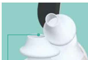
Premium mattierte Silikon Abdichtung Technologie für optimale Abdichtung

Die Silikonabdichtung liegt weich an der Nase und biegsam auf der Oberlippe mit einem eingebauten Soft-Lip™-Kissen, welches sich an die natürliche Form der Oberlippe anschmiegt und höchsten Tragekomfort gewährleistet.