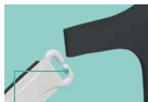
Versteckte Kopfbandöffnung One-Step Öffnung

Diese Abdichtungstechnologie bietet eine weiche, glatte Fläche, die leicht an die richtige Stelle gleitet, und die matte Oberfläche sorgt für optimale Maskenabdichtung. Das fortschrittliche Luftverteilersystem ist leise und sorgt für minimale Geräusch- und Zugentwicklung der Abluft, so dass Patient und Partner ungestört schlafen können.