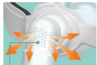
Leistungsstarke Ausatemöffnung Geräuscharmer Betrieb

Das innovative Gelenk erlaubt es, den Schlauch oben oder an der Seite zu fixieren, oder aber ihn frei beweglich zu lassen. Elegantes, einfaches Design sichert den Schlauch in der gewünschten Position. Er kann jedoch auch unverankert bleiben, so dass das Kugelgelenk sein Spiel voll entfalten kann, was volle 360° Bewegungsfreiheit schafft.