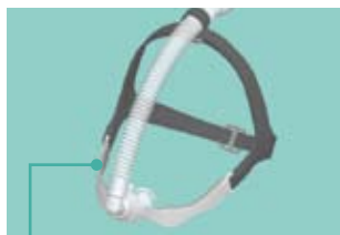
Konturierter Maskenrahmen Maskenstabilität

Die anatomisch geformten Kissen sorgen für guten Sitz und ausgezeichnete Abdichtung. Die Konturen der Nasalkissen bieten mehr Tragekomfort. Die mitgelieferten Größen (S, M, L) sorgen dafür, dass Komfort und Abdichtung nicht beeinträchtigt werden.